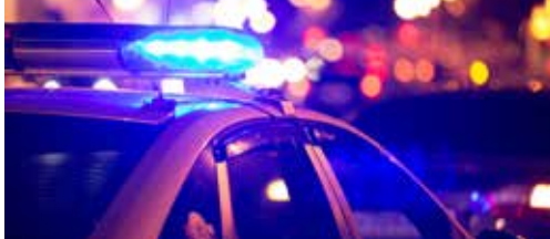
Een veiliger Hoogstraten p.2