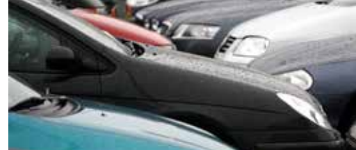
Wortel kolonie klaar voor Unesco-erkenning p.3