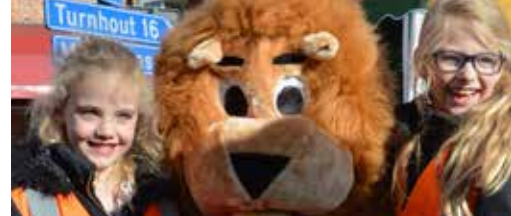
Weer veel geluk op Avondmarkt! p.3