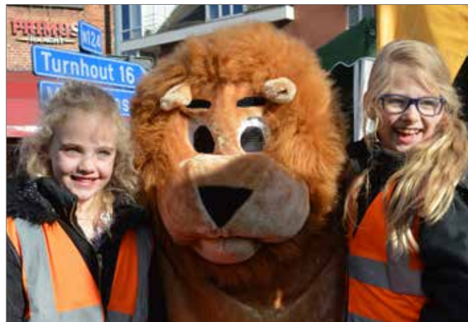
Kinderen én volwassenen genoten van een zonnige lenteavond.

De inspanning om de avond succesvol te maken, was een vermoeiende, maar tegelijk ontspannende en vooral deugddoende ervaring. Het liet de bestuursleden toe om een stukje jeugdig enthousiasme te herbeleven. Het geluk in de ogen van de aanwezigen stemde ons zeer tevreden. Een welgemeend dankjewel daarom aan alle N-VA-medewerkers, alle N-VA-leden en alle bezoekers van de Avondmarkt.