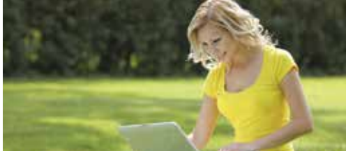
Betere gemeentelijke dienstverlening p.2