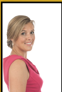
Faye Van Impe schepenen van jeugd, onderwijs en samenleving bevoegd voor onderwijs, jeugd en samenleving, inburgering, armoedebestrijding, preventieve gezondheidszorg en mondiaal beleid